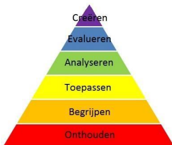
Taxonomie van Bloom